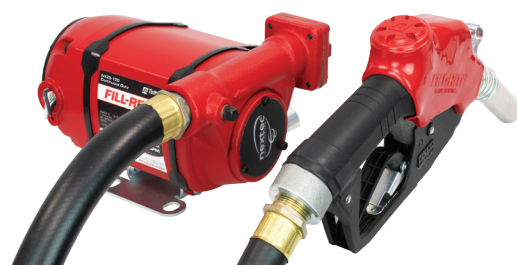
Configuration de montage sur socle NX25-120NF-AA