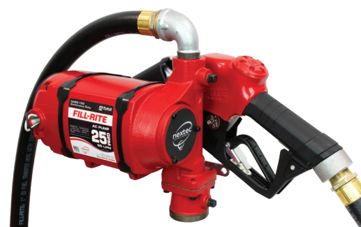
Configuration de montage sur bonde NX25-120NB-AA